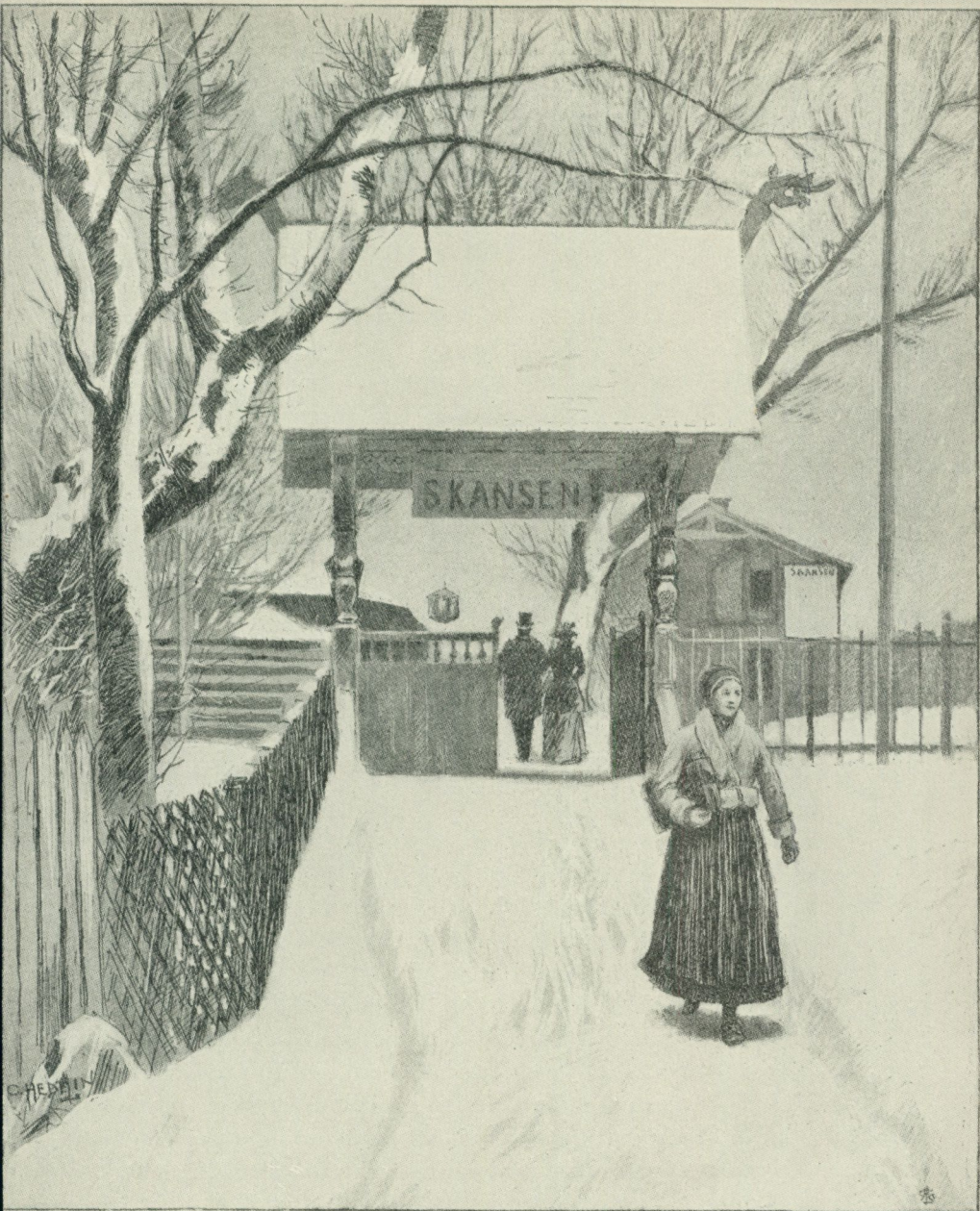
Bild 1. Skansens ursprungliga ingång. Teckning av Carl Hedelin. Ny Illustrerad Tidning 23 jan. 1892.