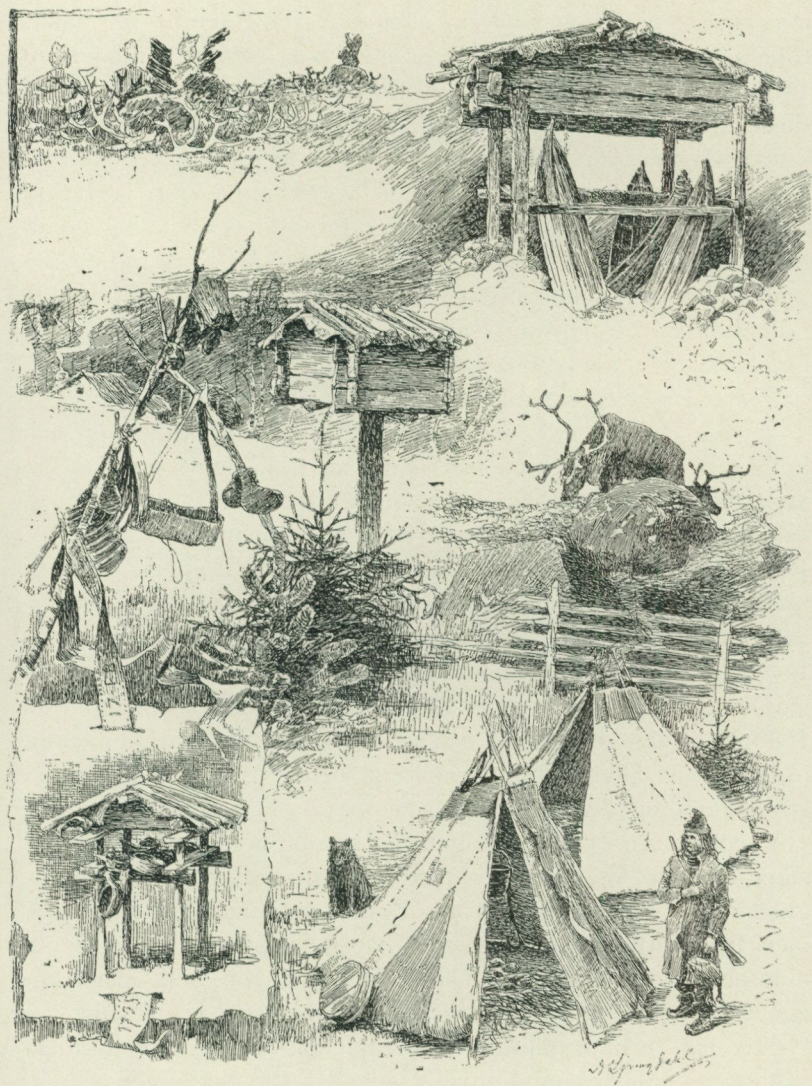
Bild 2. Offerholmen (överst till vänster) och lapplägret på Skansen. Teckningar av David Ljungdahl. Ny Illustrerad Tidning 31 okt. 1891.